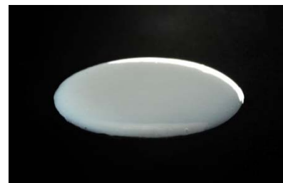
「自家培養軟骨ジャック®」

今回の仕様変更は、患者の身体的負担の軽減と医師の移植手技の簡便化を実現するものです。