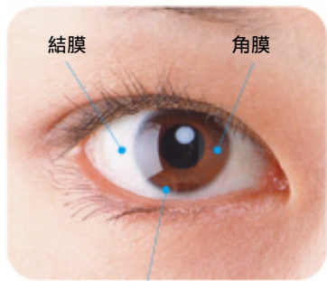
輪部:角膜と結膜の境界にあり、角膜上皮細胞の幹細胞が存在する。

角膜上皮は、眼の最表層に位置し、結膜と角膜の境界領域である輪部に存在する角膜上皮幹細胞が細胞源になっています。角膜上皮幹細胞が消失すると角膜上皮幹細胞疲弊症と呼ばれる状態となり、角膜が混濁し、視力低下の原因となります。角膜上皮幹細胞疲弊症の原因には、先天性のものとして無虹彩症や強膜化角膜、外因性のものでアルカリ腐食や熱傷、内因性のものでスティーブンス・ジョンソン症候群や眼類天疱瘡、そのほか特発性のもものが挙げられます。